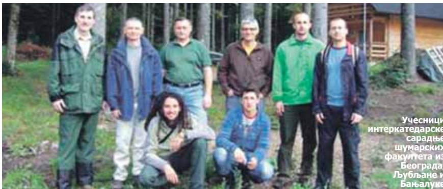
Учесници интеркатедарске сарадње шумарских факултета из Београда, Љубљане и Бањалуке

Сусрет је означио почетак нове фазе у сарадњи између катедри Гајења шума ове три земље, а на састанку је разговарано о темама које су актуелне с аспекта газдовања и узгоја шума. Размјеном знања и искустава отворена је могућност за реализацију неких интересантних идеја, а тренутно је највише пажње посвећено истраживању еколошких услова и карактеристика подмлатка у прашумама на планинским масивима динарида. Већ наредног дана сви учесници су посјетили прашуму Лом, гдје су постављене огледне површине у облику трансеката. У наредних неколико дана на овим трансектима вршена су снимања склопа, мјерења режима свјетлости и карактеристика подмлатка уз прикупљање микрофитоценолошких снимака приземне флоре. По завршетку теренских радова сумирани су теренски подаци и планиране будуће