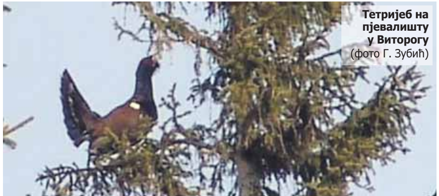
Тетријаб на пјевалишту у Виторогу

Горан Зубић је 17. јуна 2010. године одбранио магистарски рад на Шумарском факултету Универзитета у Београду, одсјек Ловство и заштита ловне фауне, на тему: "УТИЦАЈ АНТРОПОГЕНОГ ФАКТОРА НА СТАНИШТЕ ВЕЛИКОГ ТЕТРИЈЕБА ( Tetrao urogallus L. ) НА ПОДРУЧЈУ ВИТОРОГА У РЕПУБЛИЦИ СРПској".