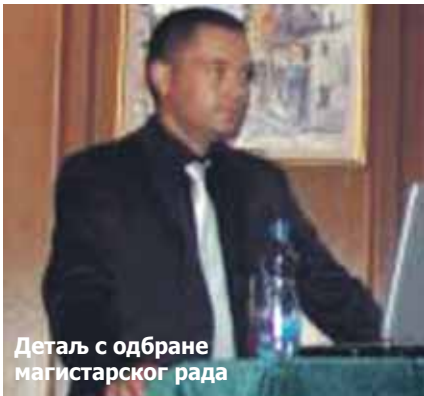
Детаљ с одбране магистарског рада